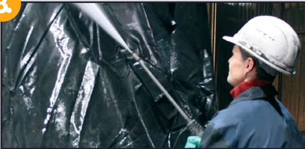
Reinigung und Trocknung