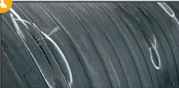
Kennzeichnung der Schäden