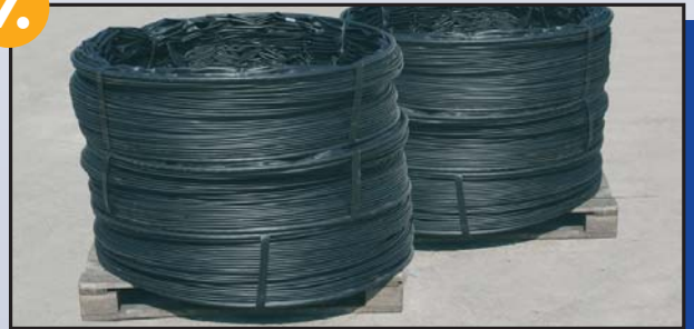
Verpacken und wiegen