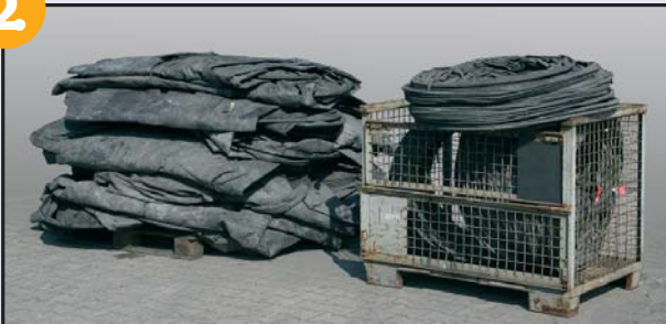
Prüfung und Sortierung